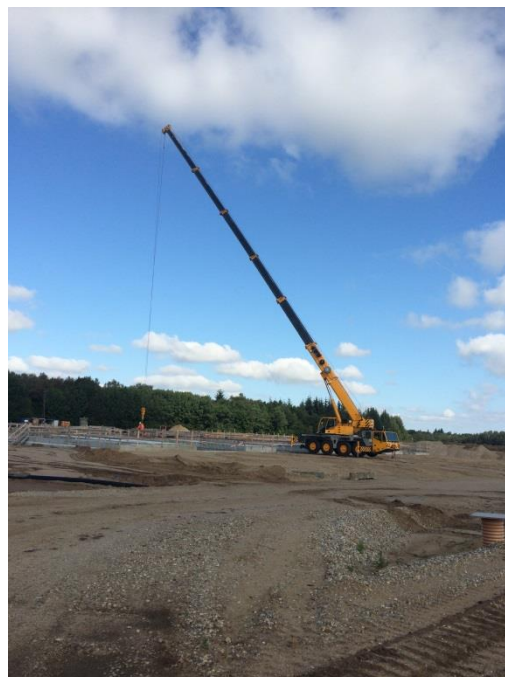
Kranarbejde på byggepladsen d. 08.09.15