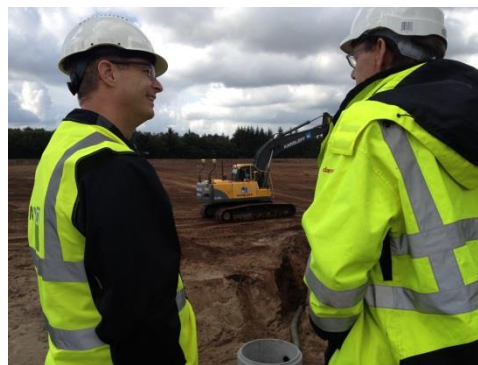
Billede fra byggepladsen i Tønder d. 03.09.15