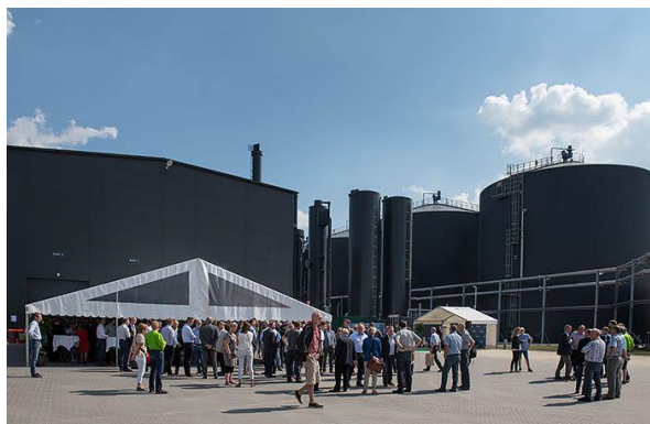
Billede af NGF Nature Energy Holsted ved indvielsen

På grund af besøg af Grete Sillasen fra den danske ambassade i Argentina, kunne vi desværre ikke deltage i indvielsen af NGF Nature Energy Holsted d. 21.08.2015.