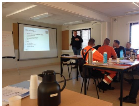
Billede af sikkerhedsskolen d. 07.09.15

hjem igen. Det var en rigtig god formiddag med gode input og til slut en oplistning af nogle konkrete målsætninger, som skal være værdiskabende under de fremtidige byggeri.