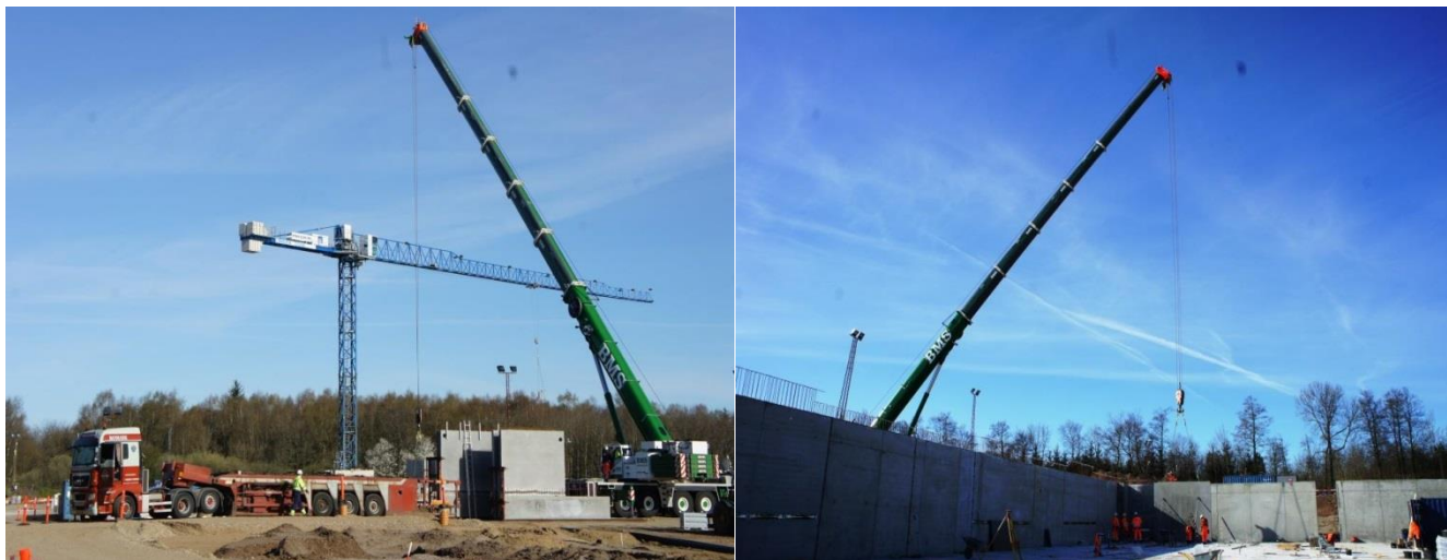
Billederne er taget mandag den. 20. april

I uge 20 og 21 vil der igen være ca. 60 lastbiler, der kører i pendul fart til og fra pladsen med beton, der skal bruges til at støbe dæk til kælderen. Det er utrolig spændende at se den positive fremdrift, der er på byggepladsen og biogasanlægget begynder mere og mere at tage form.