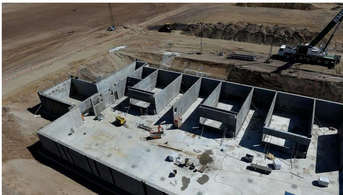
Betonelementerne blev monteret i kælderen.

Der har været afholdt dialog-og koordineringsmøde med Tønder Kommune, som starter deres anlægsprojekt, der omfatter etablering af rundkørsel ved Aabenraavej, en sideudvidelse og en opgradering af Midtmosevej til asfalteret vej.